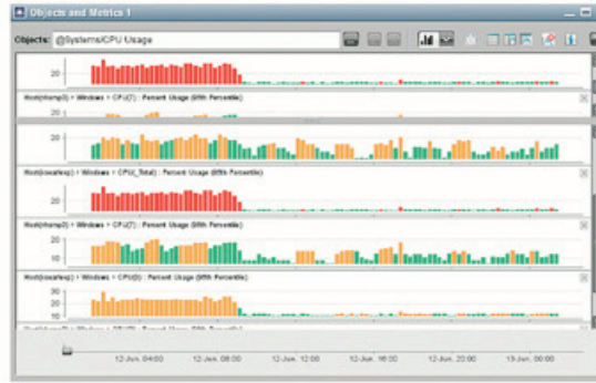
Correlaciona métricas de rendimiento a través de las capas de las Aplicaciones para Identificar en forma automática métricas relacionadas con el diagnóstico de la causa raíz de problemas de rendimiento.